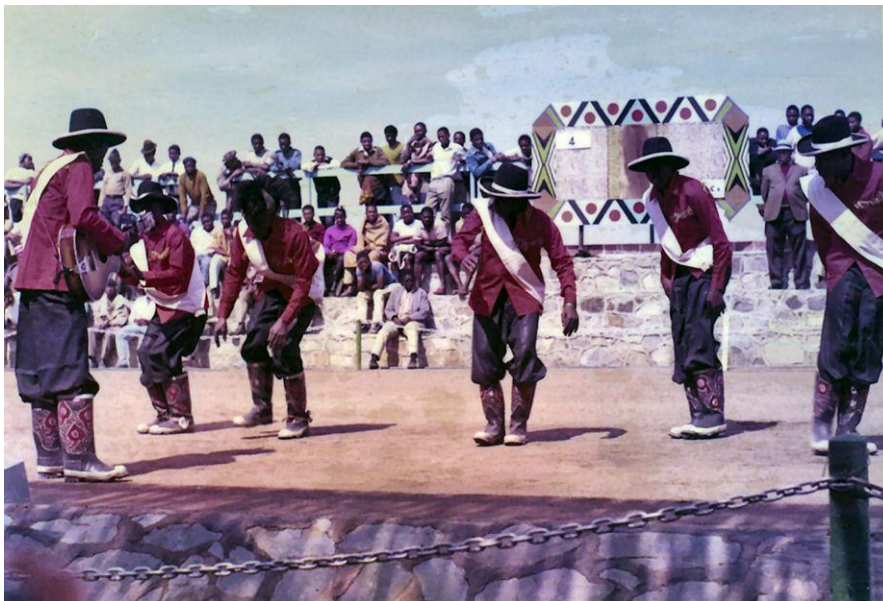
Gun Boots dance nelle miniere d'oro

Questo processo e' avvenuto senza spargimento di sangue. Mandela fu l'artefice di questo cambiamento drammatico, dopo che si era fatto ben 27 anni di prigionia a Robin Island.