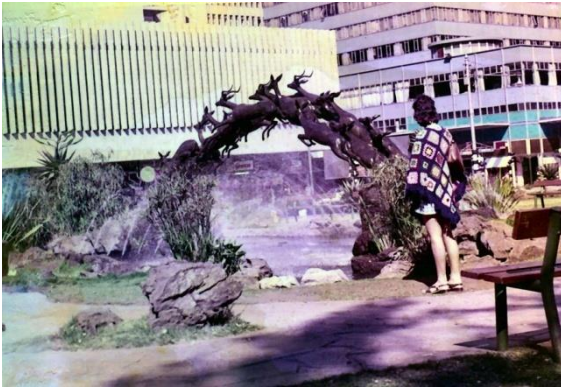
Una bellissima fontana a Johannesburg

di razza diversa. Questo era terribile e ci sarebbero voluti numerosi anni prima che il muro dell'apartheid collassasse per lasciare spazio ad una società multiculturale e libera dove gli esseri umani non erano divisi a causa del loro colore.