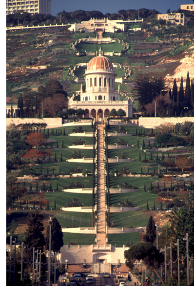
Mausoleo del Bab a Haifa

Poi, Israele e' venuto spesso alla cronaca per la tragedia millenaria del suo popolo, per la sua diaspora e tentativi di annichilimento durante tre mila anni di storia, con gli Egizi, con Nabucodnosor e la Dinastia Caldea di Babilonia, con l'uccisione di migliaia di ebrei e l'esilio dei rimanenti fra i secoli 5° e 6° a.C., poi con i Romani e la distruzione di Gerusalemme e del Tempio