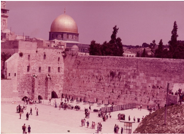
Muro del Pianto

Israele, e' sempre stata sin da giovane un paese che ha attratto la mia attenzione. Era stata la patria dove nacque Gesu di Nazareth e della Religione Cristiana in cui sono nato, era stata anche la terra promessa da Dio al Popolo Ebraico, ma anche la terra dove arrivo' l'Islam e dove il Profeta Maometto avrebbe volato con il suo cavallo alato, cavalcato nel corso della sua seconda discesa nel mondo terreno. E' poi anche stata la terra toccata dalle due recenti Manifestazioni di Dio che diedero vita alla Fede Baha'i. Per questo, in un blocco di immagini ve ne e' uno chiamato " Israele Crocevia di quattro religioni monoteistiche ". La Fede Ebraica, rappresentata col suo Muro del Pianto, quella Cristiana con il Santo Sepolcro, quella Mussulmana con la Moschea di Omar, e quella Baha'i con il Mausoleo del Bab sulle pendici del Monte Carmelo e il Mausoleo di Baha'u'llah a Bahji vicino alla citta' fortezza di Akko.