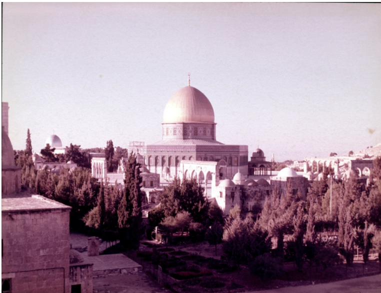
Moschea della Roccia