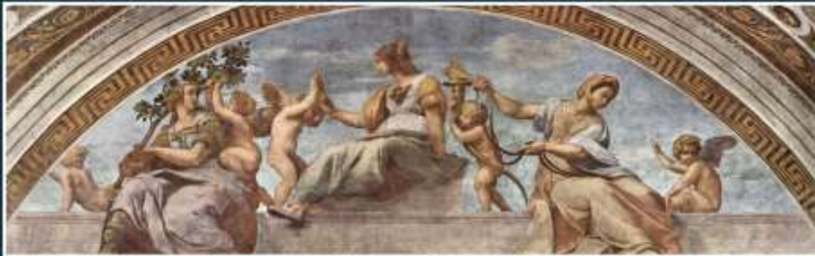
Raffaello: Sanzio Musei Vaticani - Le Virtù Cardinali